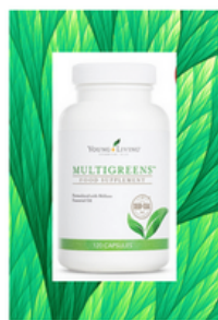
zweimal täglich je 2-3 Kapseln