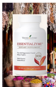
3 Festkapseln pro Tag