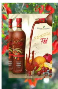
täglich morgens und abends je 30-60 ml trinken

Wir wünschen dir viel Freude! ~ Elisabeth